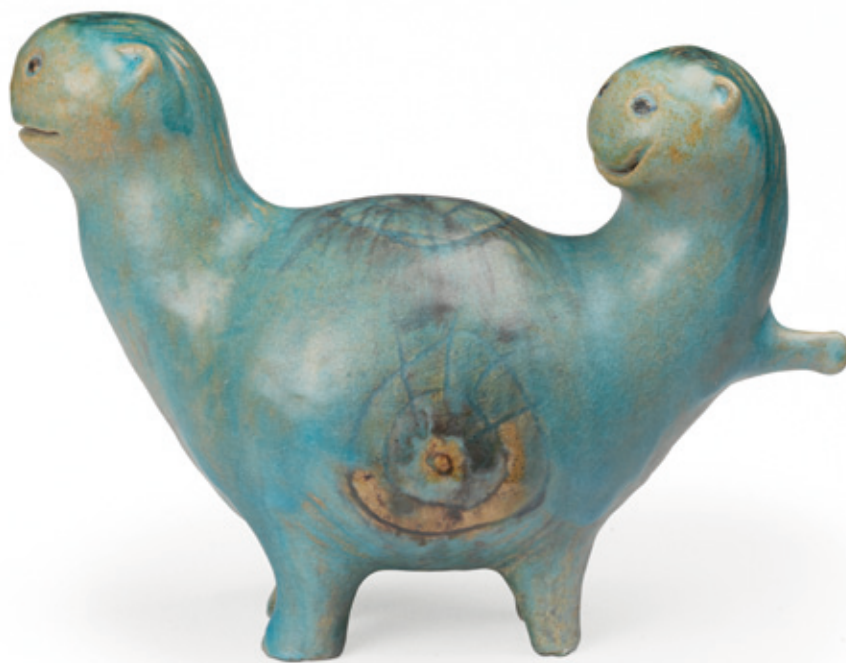
linkerpagina boven 'Plastiek van een hen', 1979, 28 x 8 cm, Gemeentemuseum Den Haag.