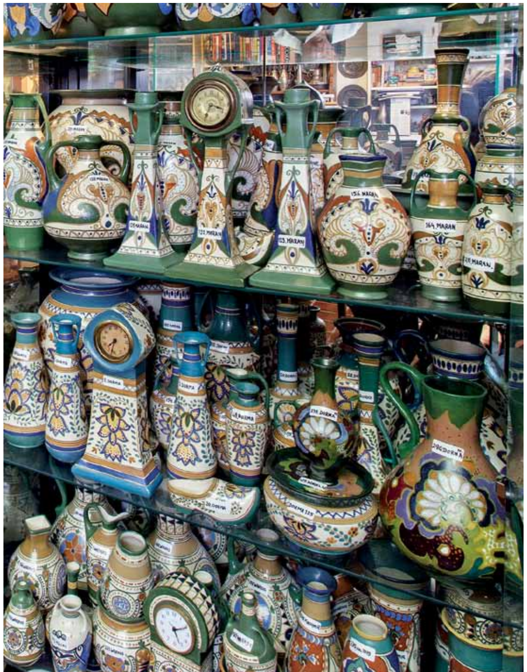
rechts Imposante collectie van de Arnhemsche Fayencefabriek.

rend hoe verschillende decors hetzelfde model een heel ander aanzien geven”, zegt Steenaert. “In de donkere decors met het glanzende glazuur is de invloed van de Haagse Plateelbakkerij Rozenburg duidelijk herkenbaar terwijl in de lichte geometrische decors de stijl van De Distel valt te ontwaren. De geometrische decors zijn op een roomkleurige ondergrond, de kleur van de gebakken klei oftewel scherf, geschilderd. Hierop is eerder een matte vernis, de zogeheten voorbrand, aangebracht. Klaas Vet beschouwde deze kenmerkende techniek, die hij destijds al uit Suhl (Saksen, Duitsland) had meegenomen en verder bij De Distel had ontwikkeld, als zijn fabrieksge-